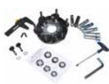
Sada s přírubou s výkyvným čepem pro uzavření ráfky 1 695 107 439