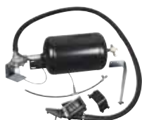
Systém pro huštění 1 695 108 137