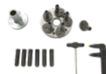
Centrovací příruha pro BMW 1 695 000 323